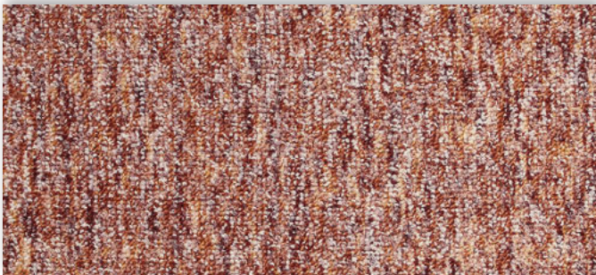
84 2m + 3m + 4m + 5m