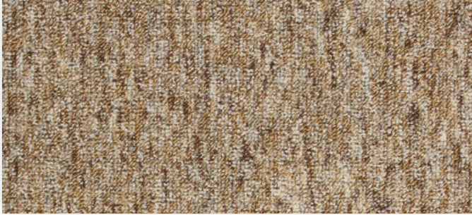
33 2m + 3m + 4m + 5m