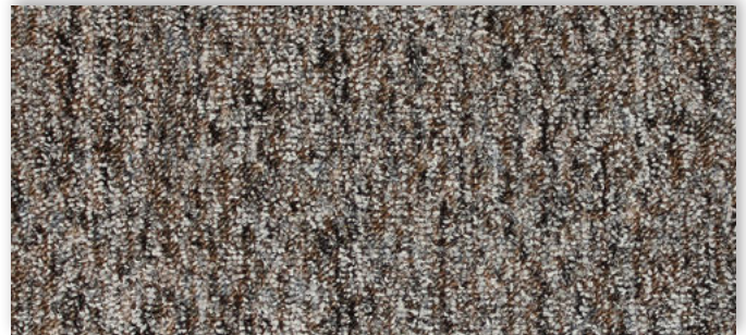
49 2m + 3m + 4m + 5m