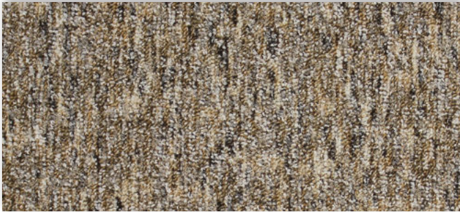
39 2m + 3m + 4m + 5m