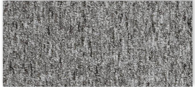
97 2m + 3m + 4m + 5m