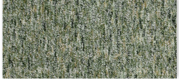
29 2m + 3m + 4m + 5m