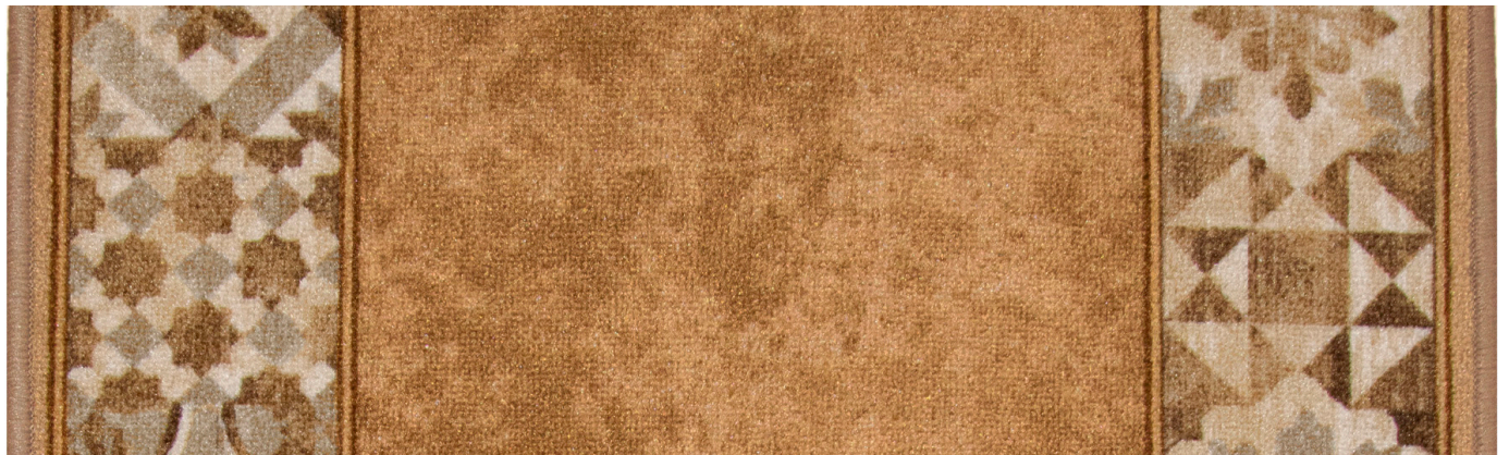
35 67cm - 80cm - 100cm