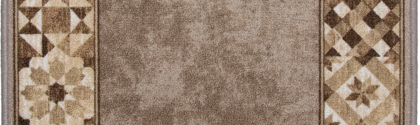
34 67cm - 80cm - 100cm