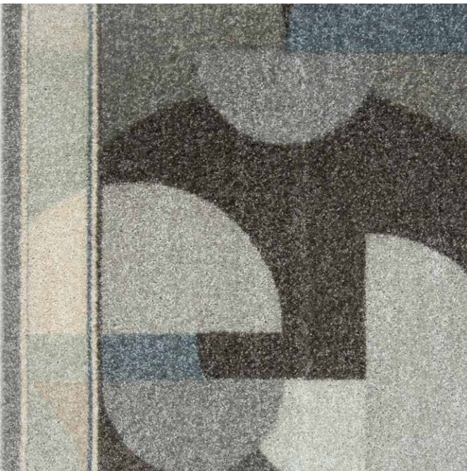
97 67cm + 80cm + 100cm

La société Associated Weavers se réserve le droit de modifier les caractéristiques de ce produit tout en conservant les mêmes qualités techniques. Il est fortement conseillé d'utiliser les coloris moyens et foncés pour les pièces à grand trafic.