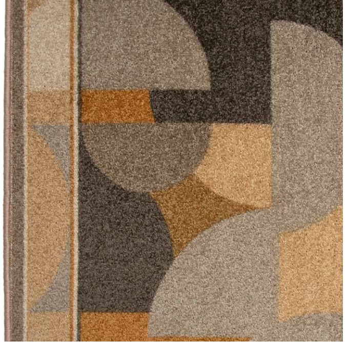
38 67cm + 80cm + 100cm