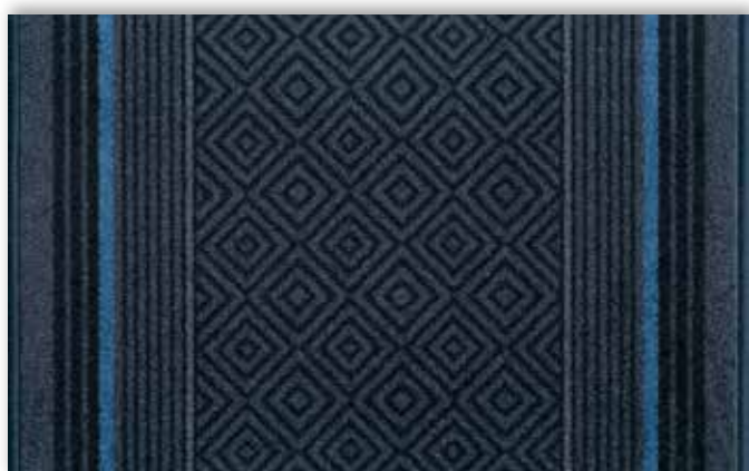
77 67cm + 80cm + 100cm