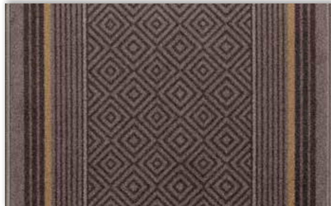
49 67cm + 80cm + 100cm