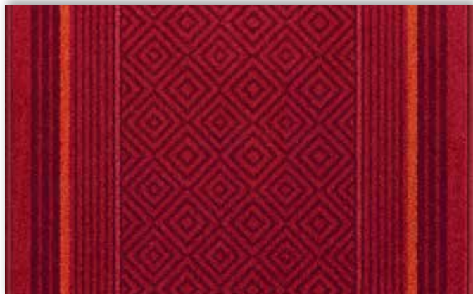
11 67cm + 80cm + 100cm