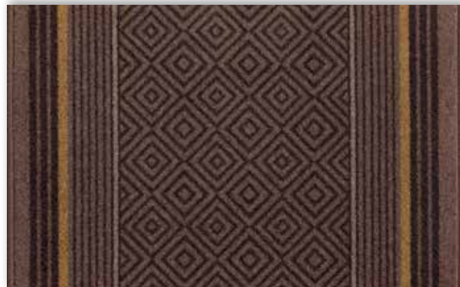
44 67cm + 80cm + 100cm