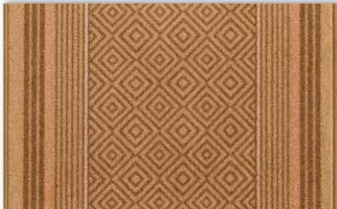
35 67cm + 80cm + 100cm